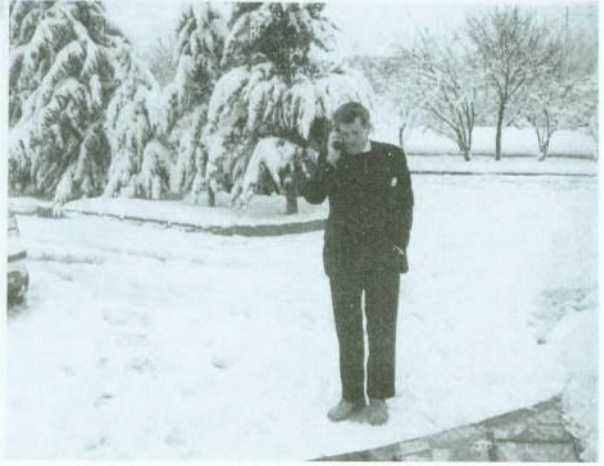
أحدت مع مستشارة الأمن القومي كوندوليزا رايس من كردستان